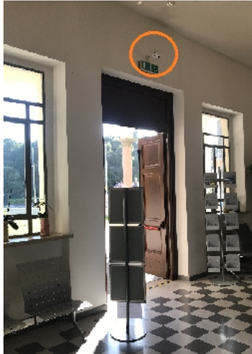
Museo Aurum Pescara

Tutte le telecamere sono cablate con cavo ethernet a punti ethernet indicati dal CED del Comune di Pescara, tranne nel caso del Museo del Mare, in cui non è disponibile al momento una rete locale, e l'ingresso posteriore del Museo Aurum: in entrambe queste situazioni la telecamera è cablata ad un router, che provvede ad inviare i dati di conteggio al sito dedicato via SIM invece che via rete.