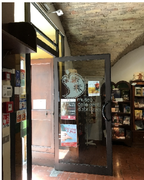
Museo Genti d'Abruzzo

Un importante progetto finanziato dalla Comunità Europea (POR FESR 2014-2020 ASSE VII SU (Sviluppo Urbano Sostenibile) per un totale di 6,9 milioni di Euro ha finanziato la valorizzazione delle risorse culturali e ambientali esistenti per migliorare l'accessibilità, con l'installazione di sistemi per il controllo e la quantificazione dei visitatori nei Musei e nei Parchi di Pescara, per mezzo di contapersone wifi e contapersone wireless .